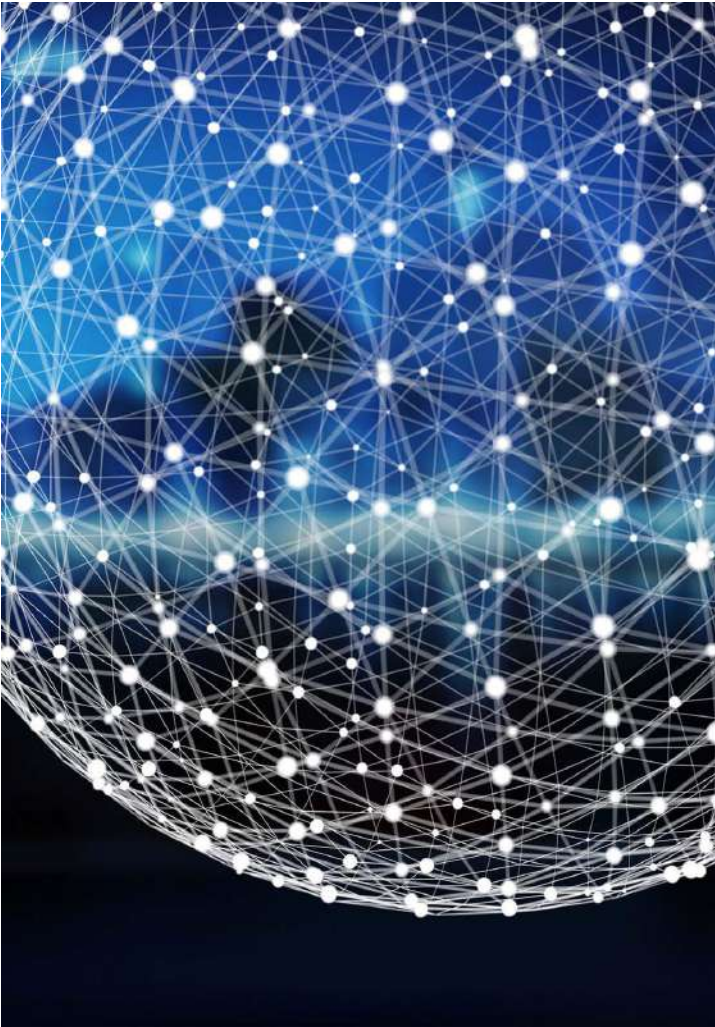
Informes de Estudios Estadísticos Detallados

Desarrollamos varias soluciones de TI eficientes, utilizables y personalizadas que corresponden perfectamente a los requisitos empresariales. Nuestra empresa es experta en el desarrollo de soluciones analíticas que permiten a nuestros clientes tomar decisiones estratégicas.